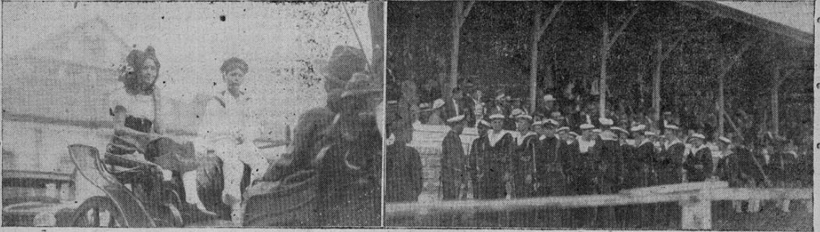
Unas de las notas más simpáticas que se ofrecieron con motivo de la llegada a esta capital de los marinos del ANTARES, fueron: en primer término la recepción que se les tributó por parte de unas señoras de esta capital vestidas de alsacianas, y, en segundo término, la manifestación de que fueron objeto esos bravos marinos en el estadio, a la hora de jugarse el sensacional match entre La Libertad y el Herediano — Ambos aspectos pueden ser contemplados en la foto anterior