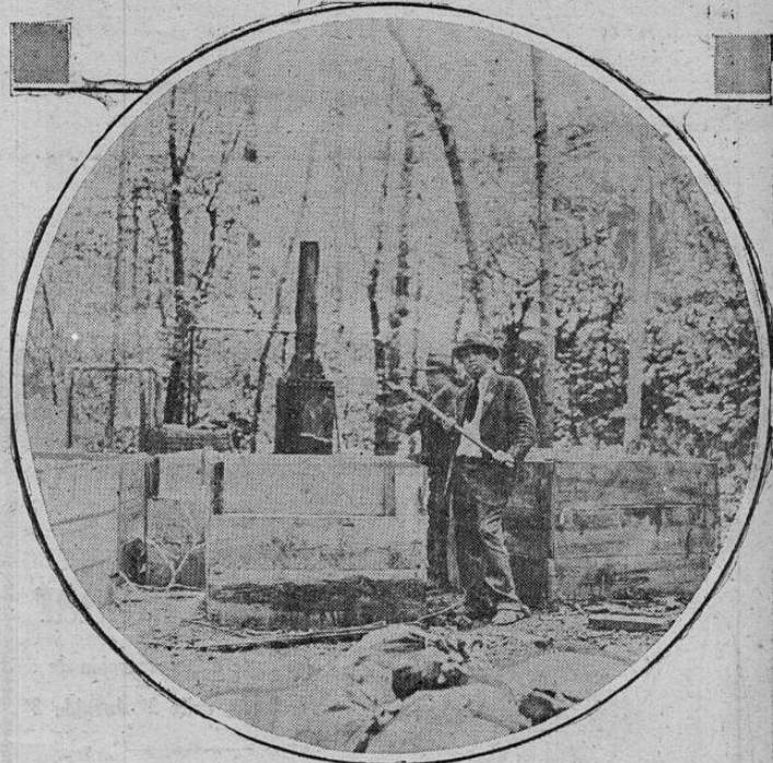
Los agentes prohibicionistas acaban de descubrir este aparato para destilar licor, en un bosque de Littleton, Carolina del Norte, y tres mil galones de fermento

Los miembros del servicio de guardacostas de Kenosha, Wisconsin, que aparecen arriba, arriesgaron sus vidas por salvar a los sobrevivientes del naufragio del vapor WISCONSIN, en el lago Michigan, que aparecen en la parte inferior del grabado